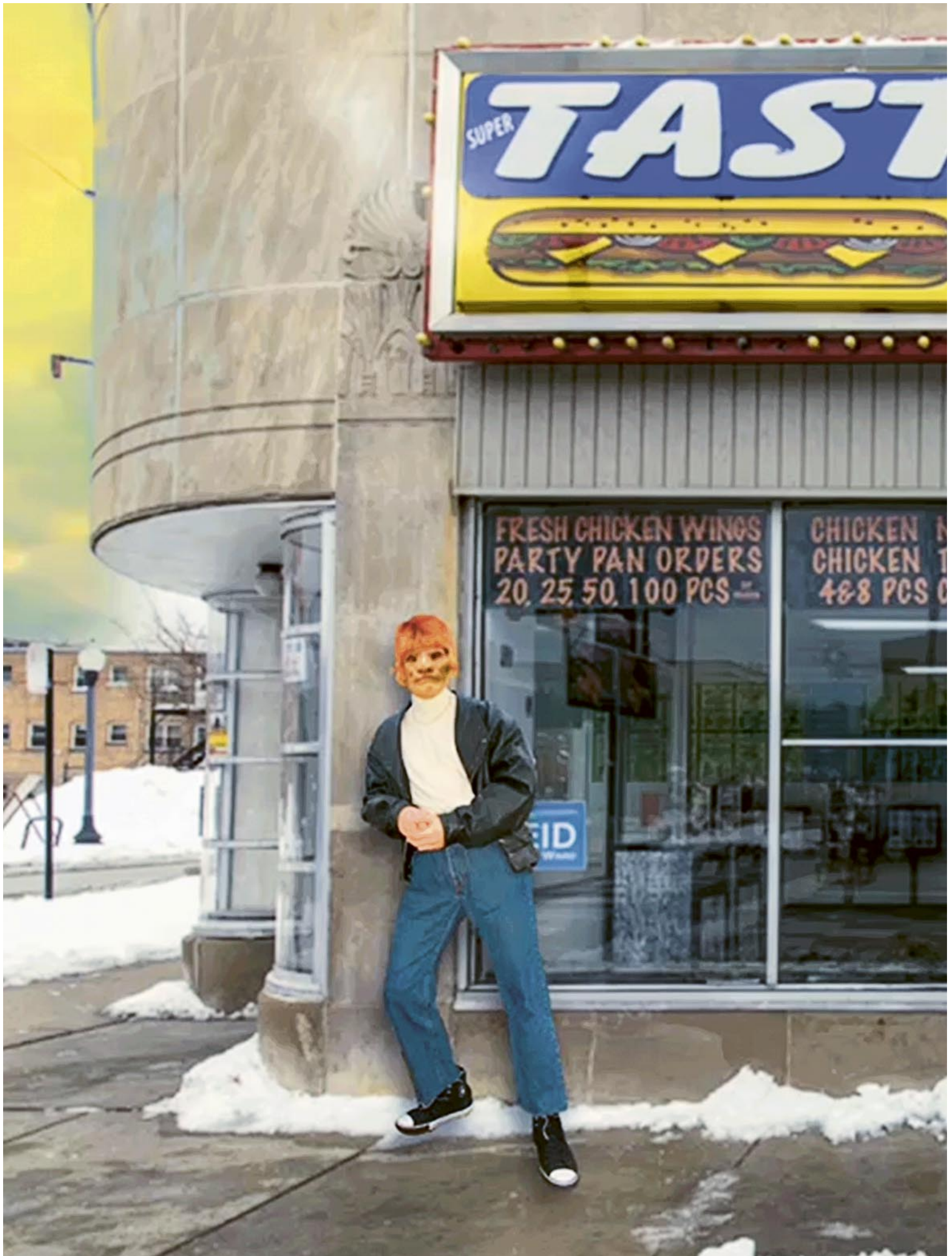
Jon Rafman: Punctured Sky: Vol. 1 (Videostill) 2021