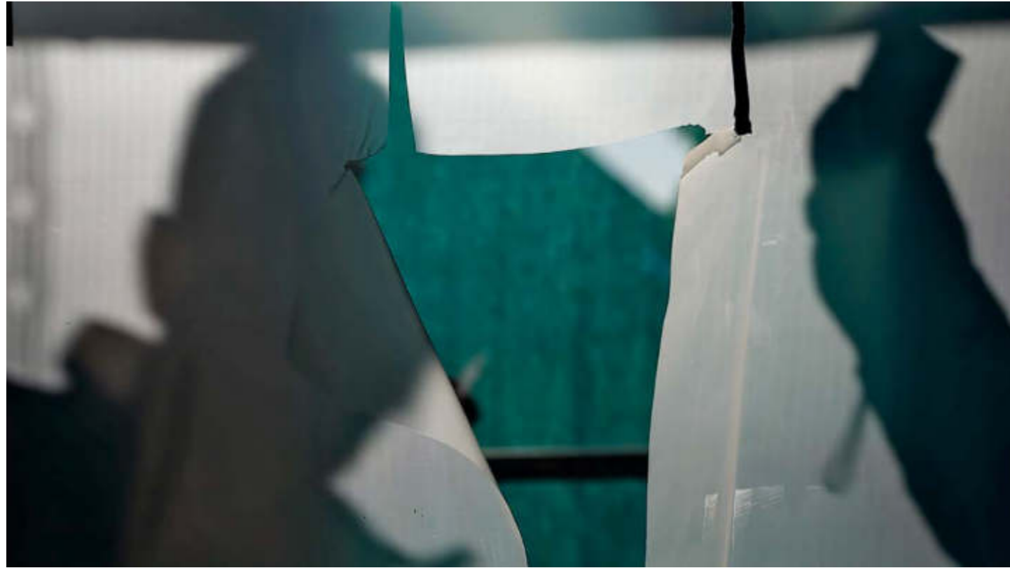
Rhetorics of the Unknown, 2021, Full HD, 7 Min. Loop