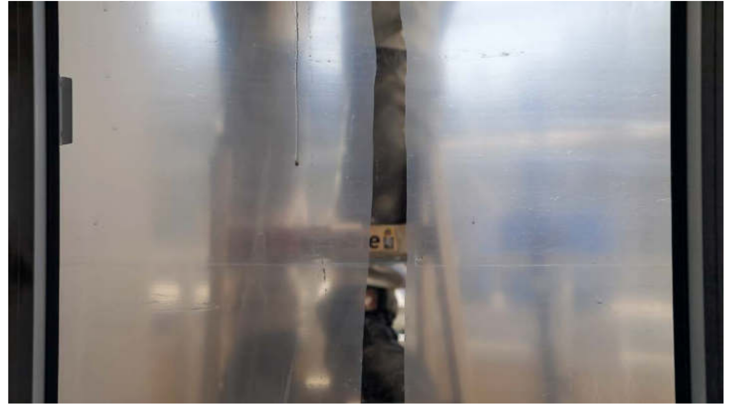
Rhetorics of the Unknown, 2021, Full HD, 7 min. loop